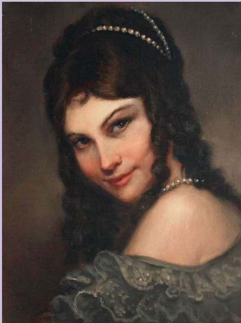
Портрет Жанны Самари. Пьер Огюст Ренуар